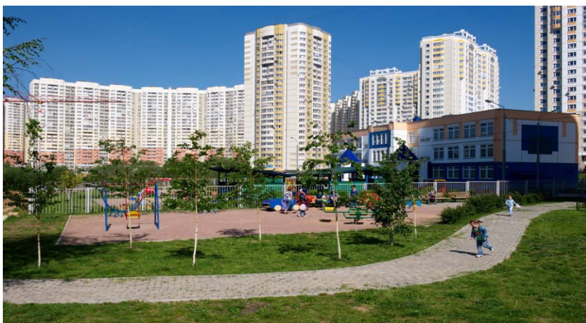
Г. Химки, «Юбилейный»