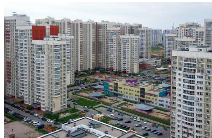
Г. Химки, «Новокуркино»