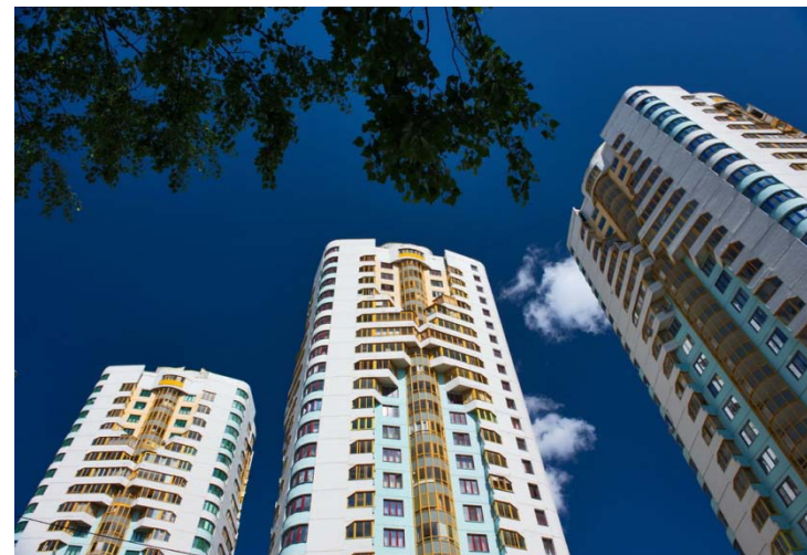
Г. Химки, «Звезда России»